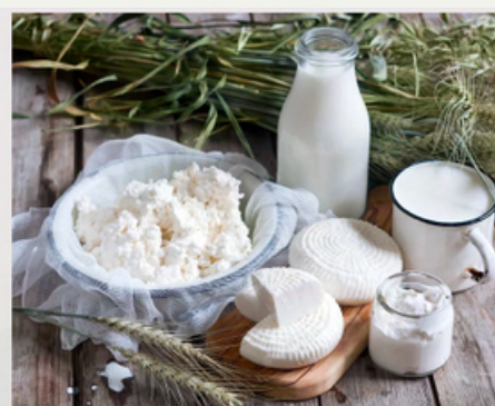
Tradice a řemesla v regionech

Program se zvířaty, projížďky na koních, ochutnávky lokálních produktů, komentované prohlídky.