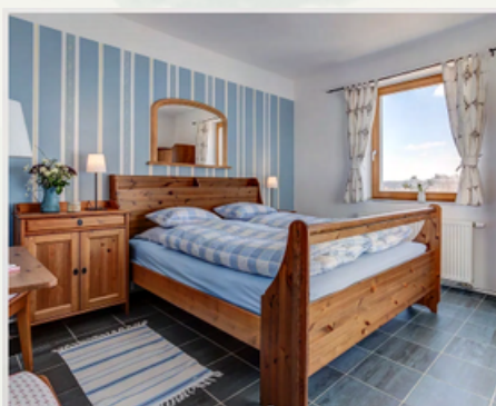
Ubytování na venkově

Nově připravený projekt "Prázdniny na venkově" představuje malebná místa s příběhem a dalšími doprovodnými aktivitami. Místa, kde si hosté mohou odpočinout a vychutnat regionální produkty bez ohledu na roční období.